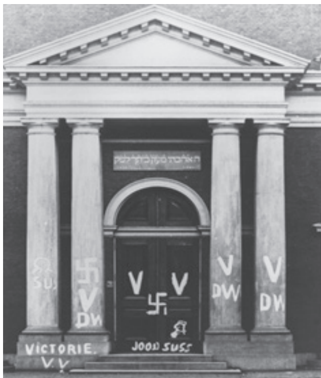
Al direct na het begin van de Duitse bezetting bekladden nazi-sympathisanten synagogen in Den Haag. De Grote Synagoge aan de Wagenstraat was vele malen het doelwit van vandalen