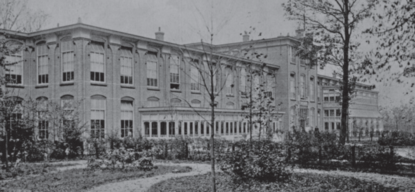
Stichting Rosenberg, kliniek Oud-Rosenburg, herenpaviljoen, omstreeks 1935