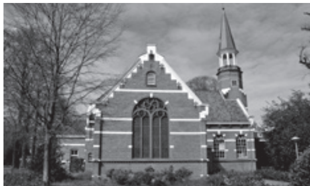
Ermelo, stichtingskerk. Verpleegsters en patiënten van de Stichting Bloemendaal vonden in oktober 1944 noodhuisvesting in de stichtingskerk van de psychiatrische inrichting Veldwijk in Ermelo. Zij verbleven gedurende vijf maanden in de kerk – foto A.E. van Kooten, Ermelo, reliwiki.nl

Veldwijk was het oudste ziekenhuis van de Vereniging tot Christelijke Verzorging van Krankzinnigen. Het verplegend personeel en de directie waren niet voorbereid op de plotselinge komst van de patiënten van Bloemendaal. Voorlopig huisvestte men de hele groep in de stichtingskerk midden op het terrein. Verpleegsters legden onrustige patiënten onder spanlakens in het portaal van de kerk. Medicijnen waren er niet, veel patiënten waren van streek, anderen bleven schreeuwen.