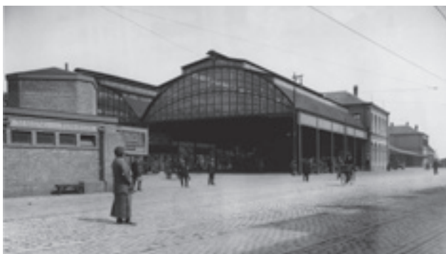
Station Staatsspoor (op de plaats van het huidige Centraal Station), omstreeks 1935. Vanaf dit station zijn de meeste Haagse Joden naar Westerbork en daarvandaan naar concentratiekampen of vernietigingskampen in Duitsland en Polen gedeporteerd