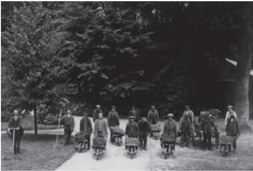
Stichting Bloemendaal, arbeidstherapie, de zogenaamde 'kruiwagenploeg', omstreeks 1935