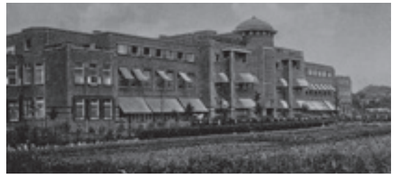
Stichting Rosenberg, Ramaerkliniek met op de voorgrond de siertuin, omstreeks 1930