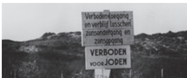
De Joodse bevolking van Den Haag kreeg vanaf het eerste bezettingsjaar te maken met anti-Joodse maatregelen. In 1941 waren vele instellingen, zoals bioscopen, theaters, zwembaden en bibliotheken, en delen van Den Haag, zoals de duinen, voor Joden verboden