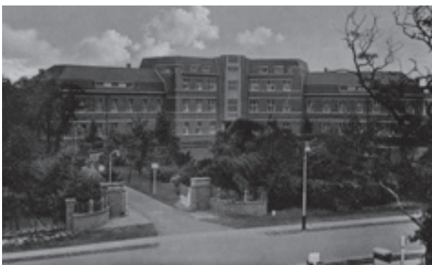
Stichting Bloemendaal, kliniek Ockenburg, omstreeks 1940