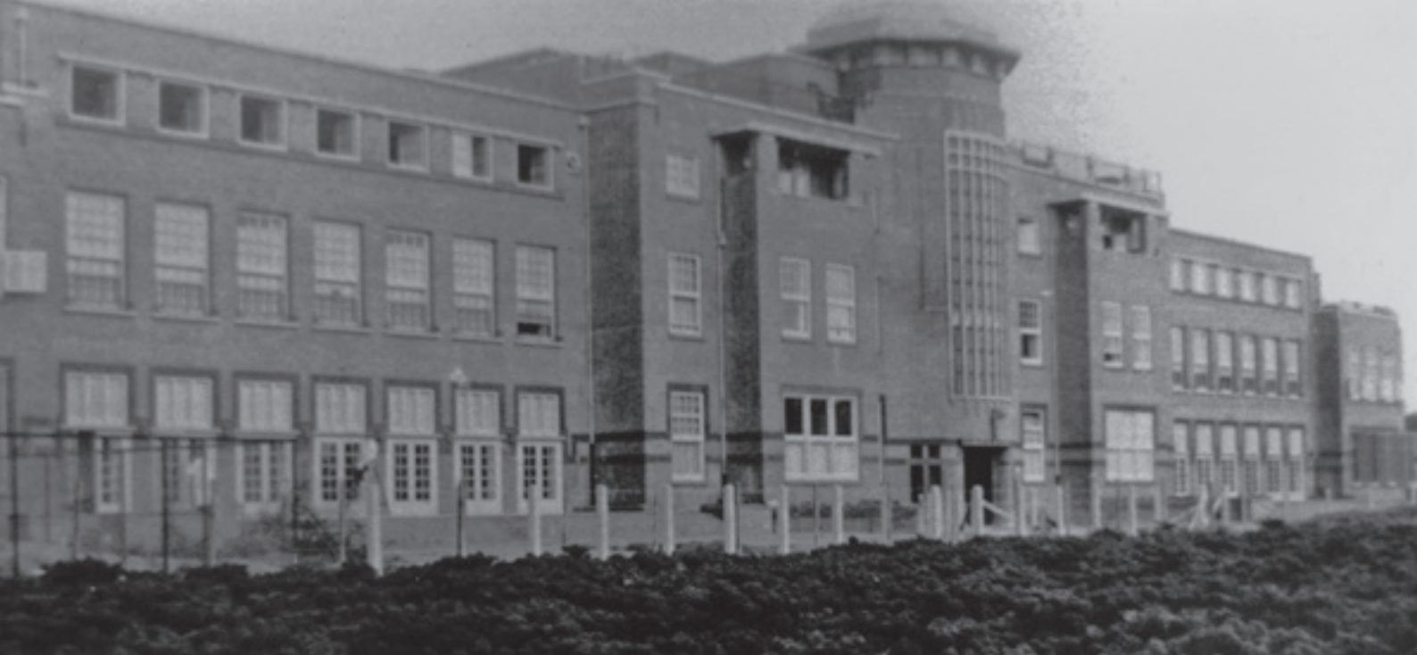
Stichting Rosenbrug, Ramaerkliniek, vanwege de voedselschaarste veranderde de siertuin in een moestuin. In 1941 verbouwde men bij de kliniek boerenkool

leken relatief veilige oorden. Mensen die werden verpleegd konden immers moeilijk op transport naar ‘het oosten’ – zoals in versluisde bewoordingen de concentratie- en vernietigingskampen werden aangeduid – worden gezonden, zo redeneerde men.