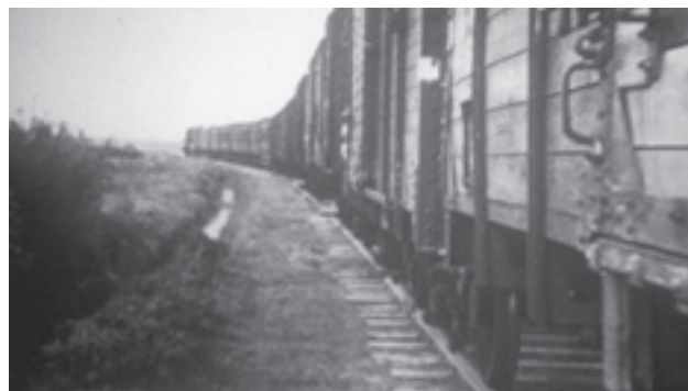
Wekelijks vertrokken vanuit het doorvoerkamp Westerbork de treinen naar de vernietigingskampen Auschwitz of Sobibor – bron: historiek.net, stills uit de film over Westerbork van R.W. Breslauer, gemaakt in opdracht van kampcommandant A.K. Gemmeke