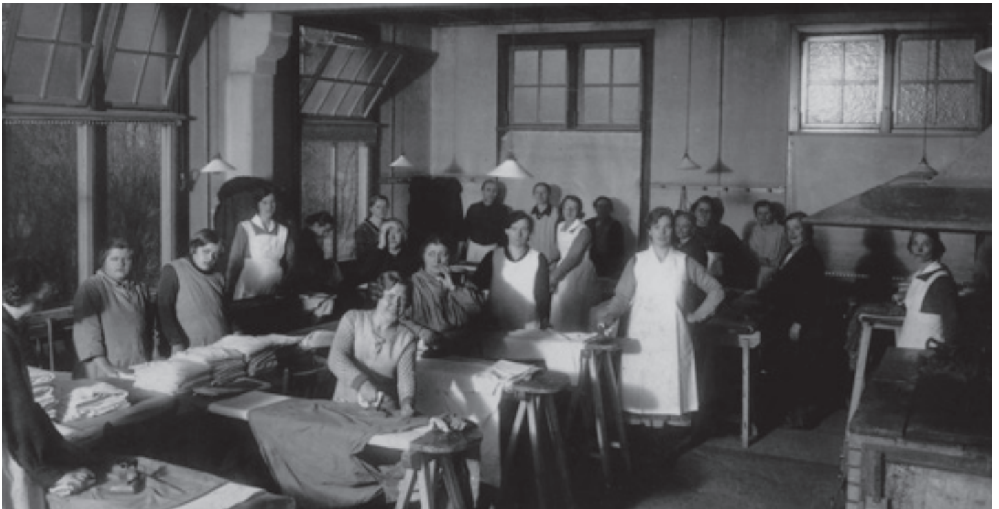
Stichting Bloemendaal, arbeidstherapie, patiënten in de strijkkamer, omstreeks 1935