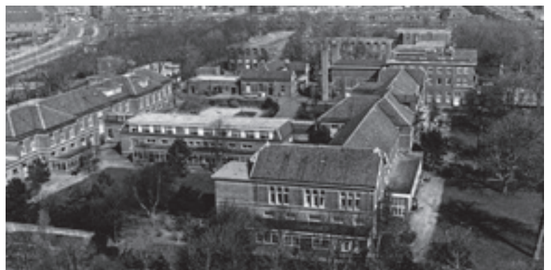
Stichting Rosenberg, gebouwen van de kliniek Oud-Rosenburg kort na 1945 – collectie Parnassia Groep