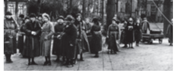
Stichting Bloemendaal, de wandelende patiënten zijn door middel van een touw met elkaar verbonden, omstreeks 1935 – collectie Parnassia Groep